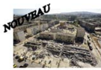
Risque « sismique »