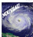
Risque « cyclone »