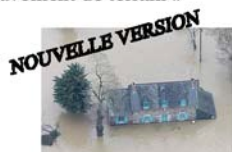
Risque « inondation »

Ils sont organisés autour des trois moments clés du risque concerné :