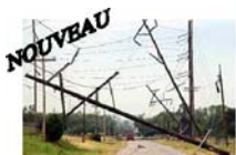
Risque « tempête »

La MRN a développé sa collection de mémentos pratiques pour sensibiliser les particuliers à la prévention. Ils y trouveront de judicieux conseils pour préserver des vies et limiter les dommages aux biens. Chaque mémento traite d'un risque spécifique.